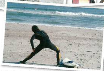
自然がすぐそこ！ウミガメも来るよ